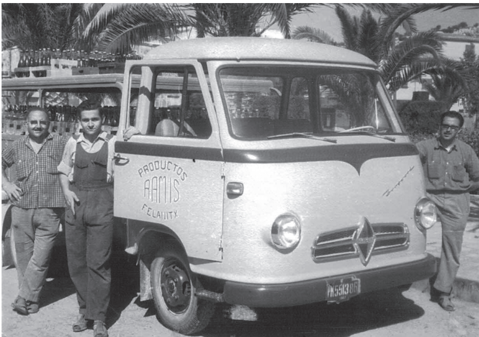
1961 - BORGWARD.

Aquesta dècada va ser l'època daurada de l'empresa, ja que amb el "boom" turístic s'obriren molts d'hotels i nous establiments per la zona, igual que a la resta de l'illa. D'altra banda els mallorquins, en veure augmentar el seu poder adquisitiu, també es van poder permetre el petit luxe de beure algun refresc.