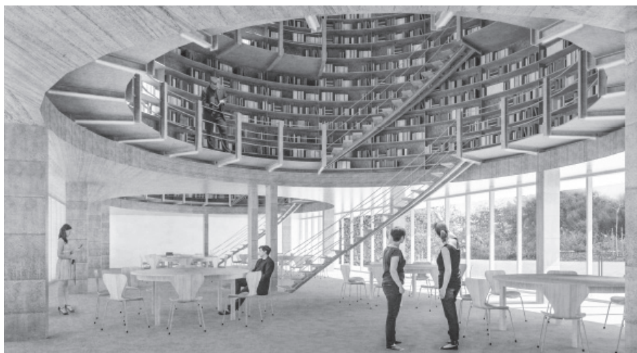
▼ Imatge d'una possible intervenció per habilitar els dipòsits metàl·lics com a biblioteca.

intervenció més radical, quedant els caps dels dipòsits com a testimoni del mar de tines que omple les naus principals.