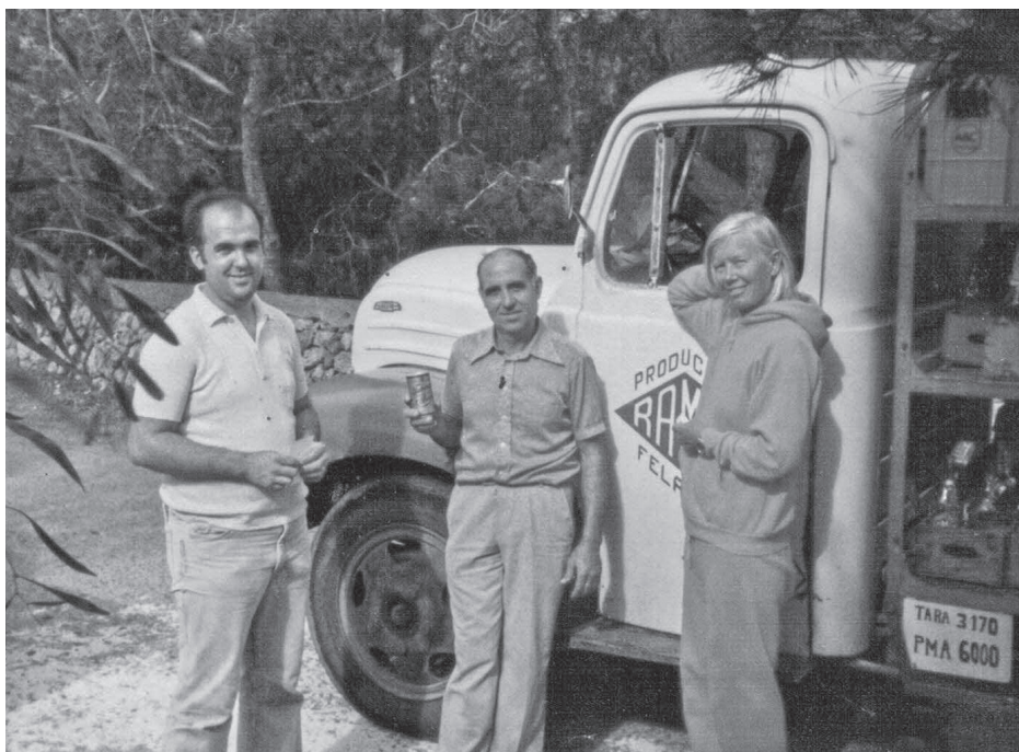
1978 - EBRO

Va ser en aquesta època quan l'empresa va treure al mercat alguns productes nous, com per exemple el "Topacio", que era una mena de bitter lemon i que s'anomenava així pel color de les botelles, semblant al de les cerveses.