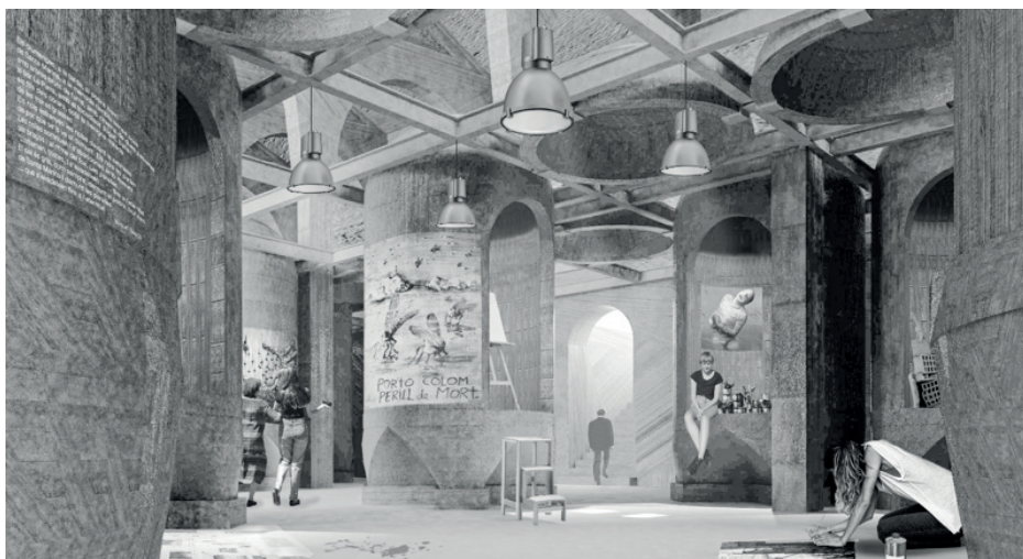
▼ Imatge d'una possible intervenció a la sala de tines.

Els centres de creació i docència d'art demanden una quantitat d'espais sense claror (fotografia, videoart...) que podrien aprofitar els grans espais que queden al soterrani sota la sala de premses. Els dipòsits cilíndrics podrien servir per crear petits àmbits de creació conjunta fent certs buidats i al mateix temps ser petits magatzems personals dels alumnes o creadors. També es podria alliberar completament la planta baixa amb una