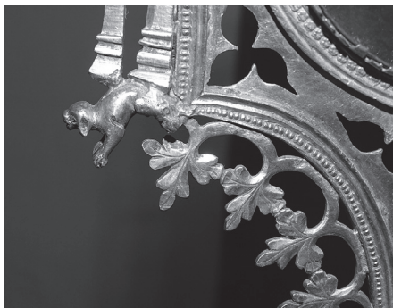
▼ Detall d'un dels cans que simulen gàrgoles.

La custòdia estructuralment pot ser dividida en tres parts: la base, la tija i l'expositor. Quatre lleonets de fosa sustenten un peu 9 (...) amb forma vuitavada amb quatre pètals petits que s'intercalen amb quatre de grossos en els que hi devia haver esmalts circulars ja que hi resten les marques. La tija s'inicia amb un cos arquitectònic quadrat (...) decorat al seu interior amb figures esmaltades que representen sants 10 . Damunt aquest cos s'aixeca un tros de canya (...) amb cisellats