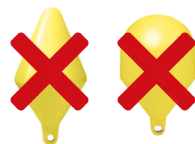
Señalizan la zona de baño